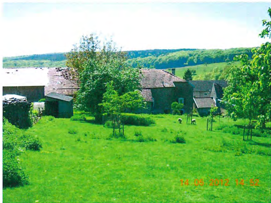
Vue depuis le fond de la parcelle

Concernant la parcelle ZC n°31, lieudit « Champs du Haut de Magnière »